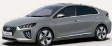
Ontdek de IONIQ Hybrid