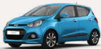
Ontdek de i10

Hyundai Bluelink in combinatie met LIVE Services is leverbaar op de volgende modellen: