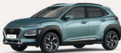
Ontdek de KONA Hybrid