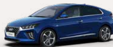
Ontdek de IONIQ Plug-in Hybrid