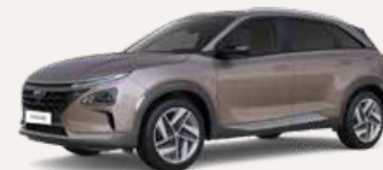
Ontdek de NEXO