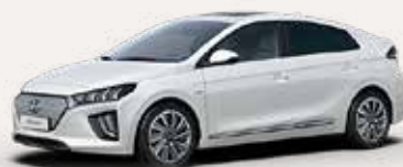
Ontdek de IONIQ Electric