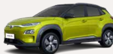
Ontdek de KONA Electric